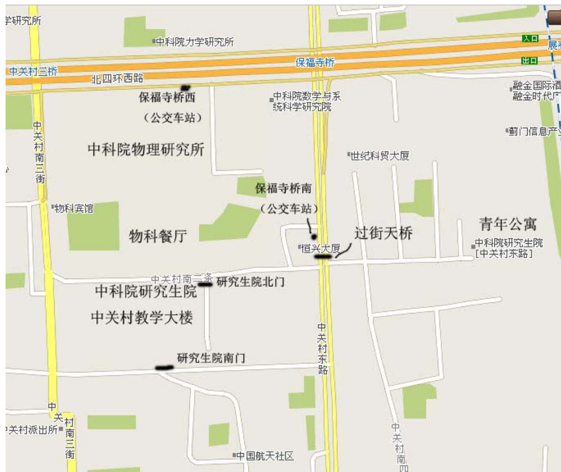
中科院研究生院中关村园区示意图